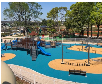
舎人公園の新しい遊具▶

足 立区の人口は69万人ですが、20年前は63万人。人口増の多くは、足立区西部を縦断する、日暮里・舎人ライナーの開通(平成20年)の影響が大きい。区の大規模イベントは以前、区民まつり、足立の花火(荒川河川敷)、しょうぶまつり(綾瀬)など、足立の南東部が中心でしたが、舎人公園千本桜まつりの開催など、 区西部地域にも税金が投下 されるようになりました。舎人公園のオープンから23年。C地区(バーベキュー広場奥の冒険の丘)が遅ればせながら、6月1日から供用開始です。