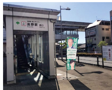
日暮里・舎人ライナー区内全駅でレポート配布▶

日 暮里・舎人ライナーの 区内全駅26出入口 で都政レポートを配布していますが、足立区西部で活動する議員の少なさを感じています。過去、都の税収不足で日暮里・舎人ライナーの開通は、計画より9年も遅れましたし、舎人公園のC地区も大幅遅れの開業です。「都予算を毎年確保して地域の発展につなげる」には、政治の力がどうしても必要となります。日暮里・舎人ライナーの混雑緩和に向けた新型車両増備など、西部地域の課題は山積。遅滞なく整備が進むように、力を傾注して参ります。