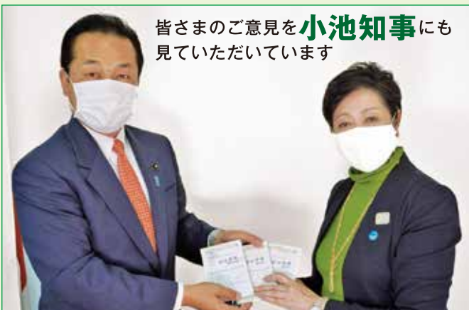
皆さまのご意見を 小池知事 にも見ていただいています

年5回発行の都政レポートを新聞に折り込み配布しています。皆さまからいただいたご意見・ご要望をとりまとめ、都政に届けてまいります。