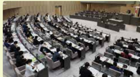
▲小池知事の所信表明

中でも極めて重要な予算は、都民ファーストの会が要望した「国の月次支援に関する都の独自支援策」です。具体例としては、酒類販売事業者の皆様には、国の月次支援と同額の、3か月で最大60万円の上乗せ支援が可能となります。緊急事態宣言下で苦しむ都内飲食事業者からの悲痛な声が届いた結果といえます。